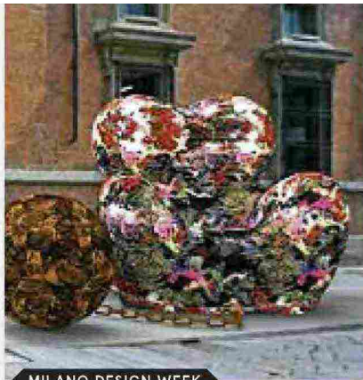
MILANO DESIGN WEEK